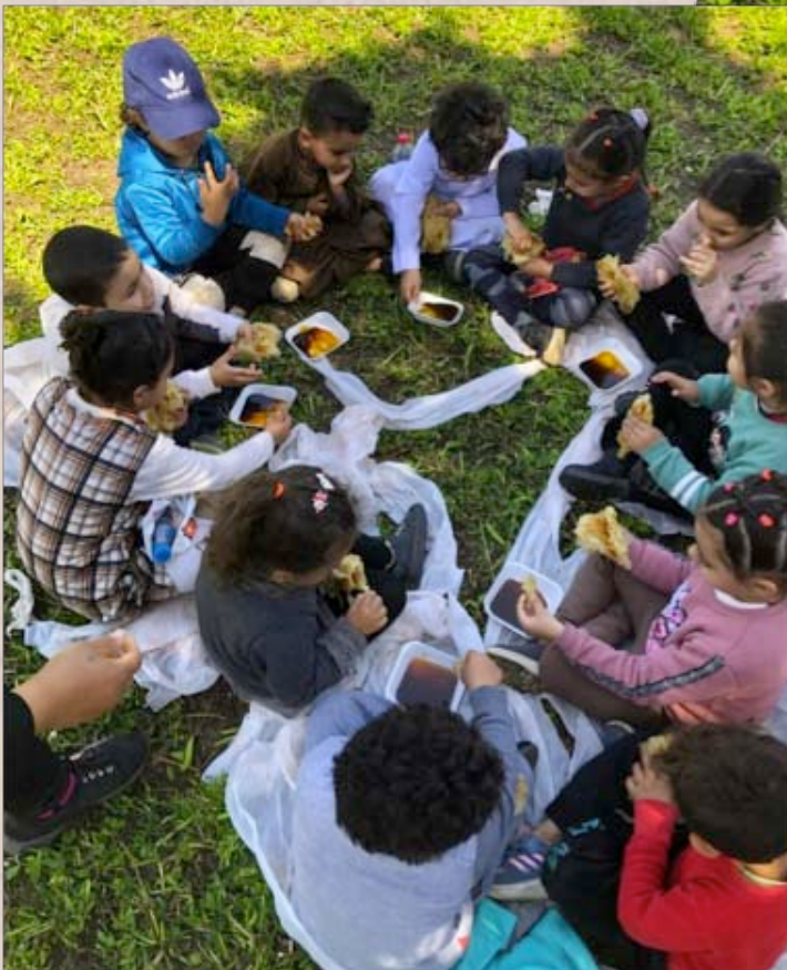
Besuch beim Fellachen Bauern